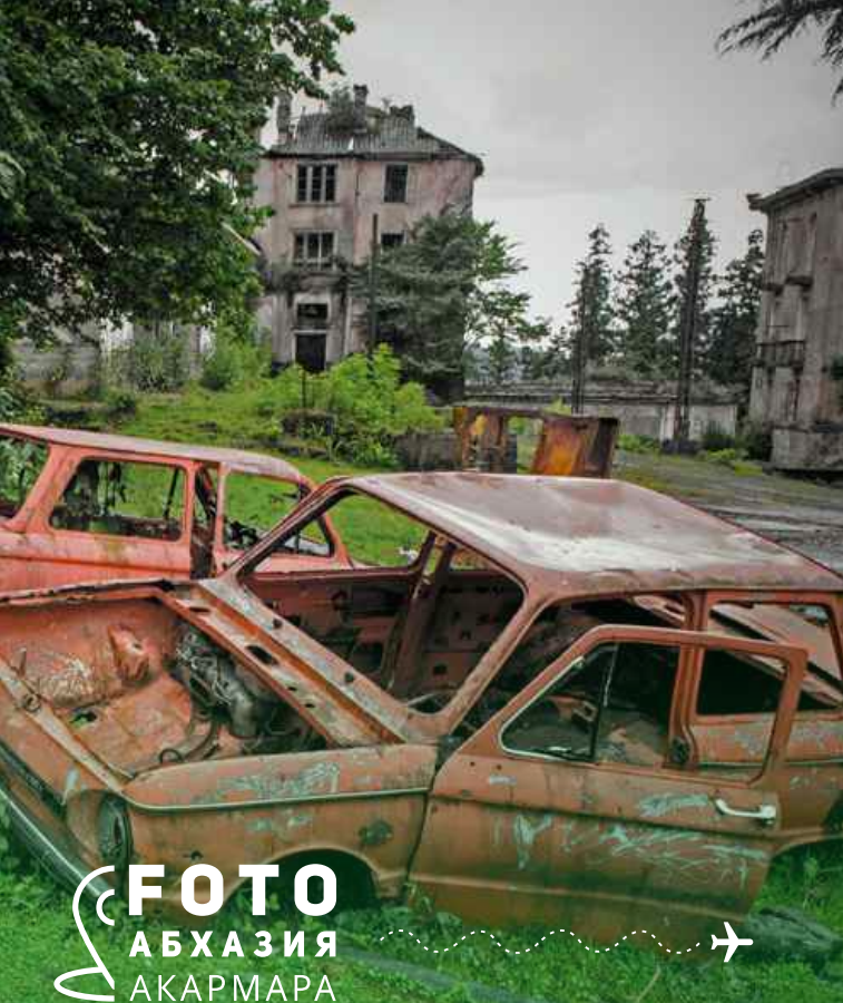
ФОТО АБХАЗИЯ АКАРМАРА

Курорты Абхазии являются одним из самых популярных направлений летнего отдыха россиян. Однако в республике достаточно специфическая обстановка, что несет ряд рисков и угроз для массового туризма.